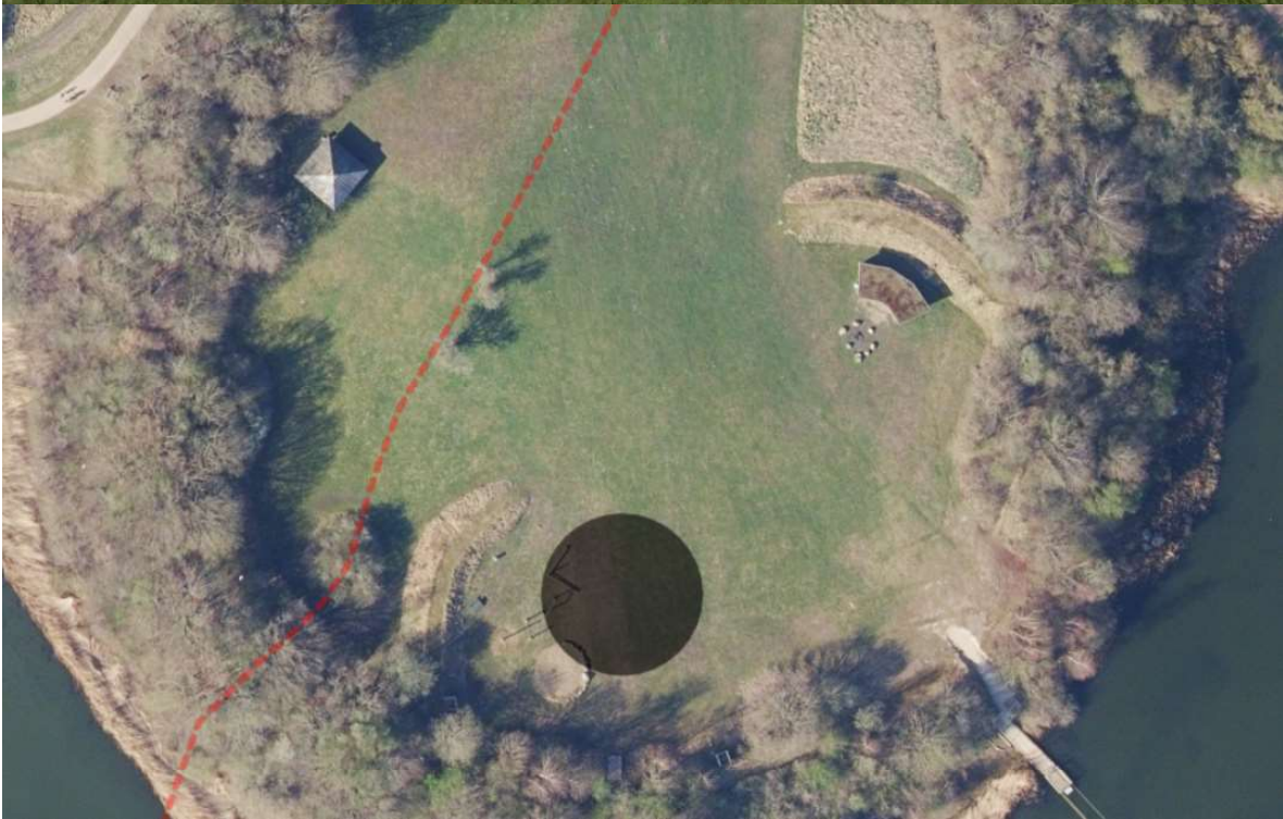
Placeringen af den nye legeplads, som vil ligge ca. samme placering som den eksisterende legeplads, der bliver fjernet.