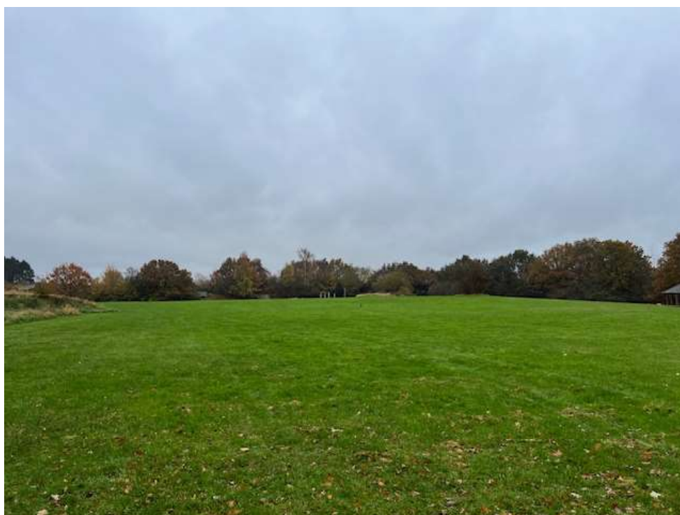
Udsyn fra stien med mod Tueholmsøen.