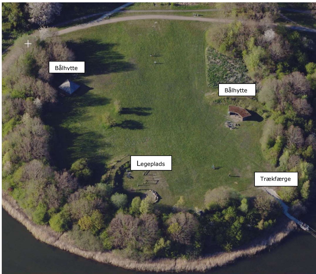
Skråfoto fra 2. september 2023.

Området er karakteriseret som en åben, grøn "slette" omkranset af et beskyttet overdrev, som er tæt bevokset. Bag overdrevet ligger Tueholmsø. Tueholmsø er på grund af overdrevet ikke synligt fra græsarealet. Området i dag består desuden af to bålhytter, en legeplads og en "trækfærge" til Kæmpetrolden Tilde. De forskellige byggerier er placeret som delelementer i tilknytning til overdrevet/skovbrynet.